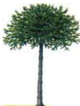
POR UNA ARAUCARIA